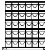
Galón (Empaque 4 Unid.)